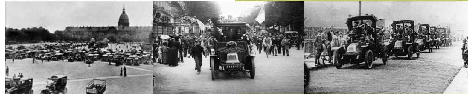
Taxistas de París camino del Marne

Jueves, 12 de abril. Salón de Actos. Edificio F. Universidad “Sergio Arboleda”. Calle 74 N°14-14