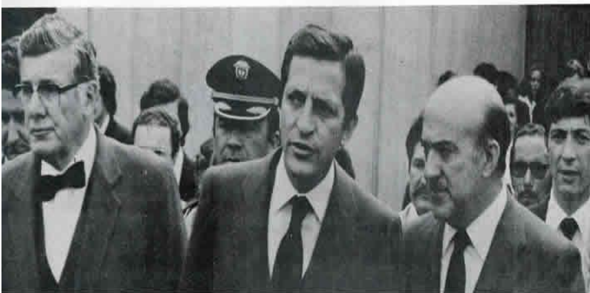
Los presidentes Turbay Ayala y Adolfo Suárez en el acto inaugural

La acción educativa española en el exterior tiene como objetivo fundamental la difusión de la lengua, la cultura y el sistema educativo español. En este marco, España y Colombia suscribieron el 4 de noviembre de 1952 un acuerdo de carácter cultural por el que ambos países se cedieron un terreno para la construcción de las instituciones "Miguel Antonio Caro" en España, y "Reyes Católicos" en Colombia.